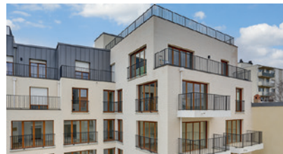
Montreuil - La Closerie 104 Architecte : Nicolas Miessner